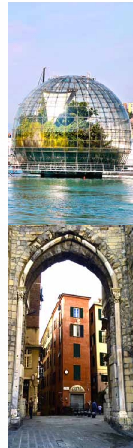
Foto rechtsboven: De glazen kas, La Bolla, ontworpen door de Italiaanse architect Renzo Piano. Deze botanische kas ligt in de haven, vlak bij het grootste aquarium van Europa.