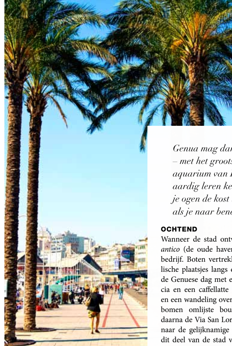
Tekst Miriam Bunnik

Hier vind je het geboortehuis van Columbus